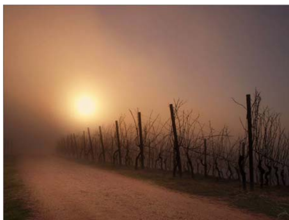
Fot. 1. Jeśli rysunek nie jest na całą szerokość strony, to proszę ustawić go na środku, wtedy brzegi rysunku wyznaczają początek i koniec podpisu pod rysunkiem